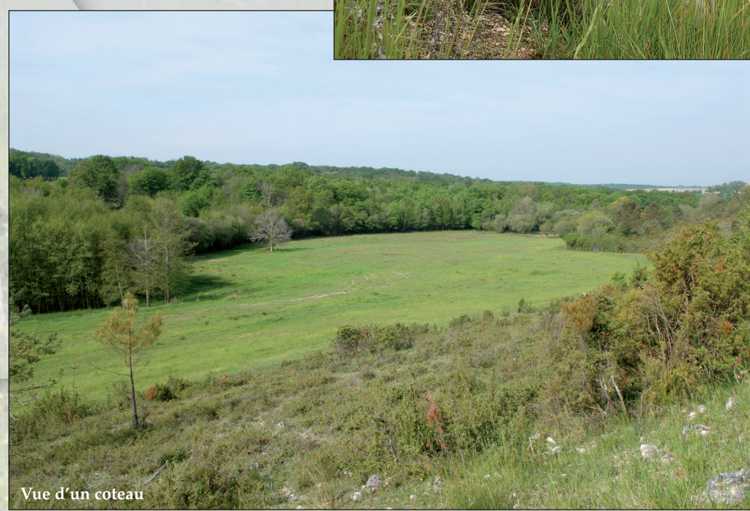
Vue d'un coteau