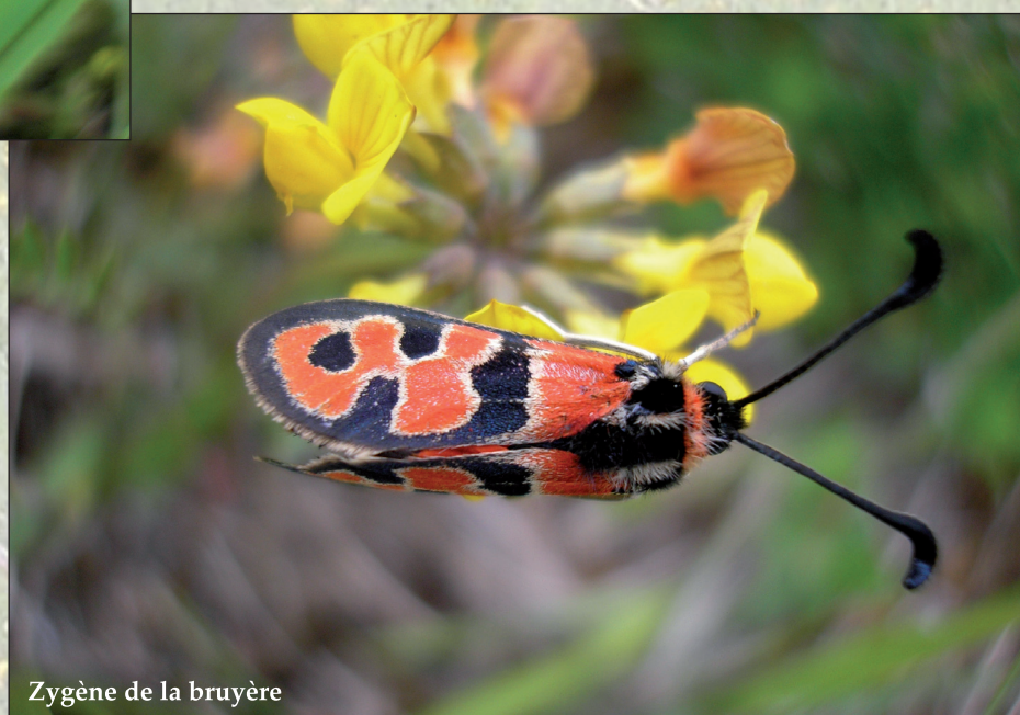
Zygène de la bruyère