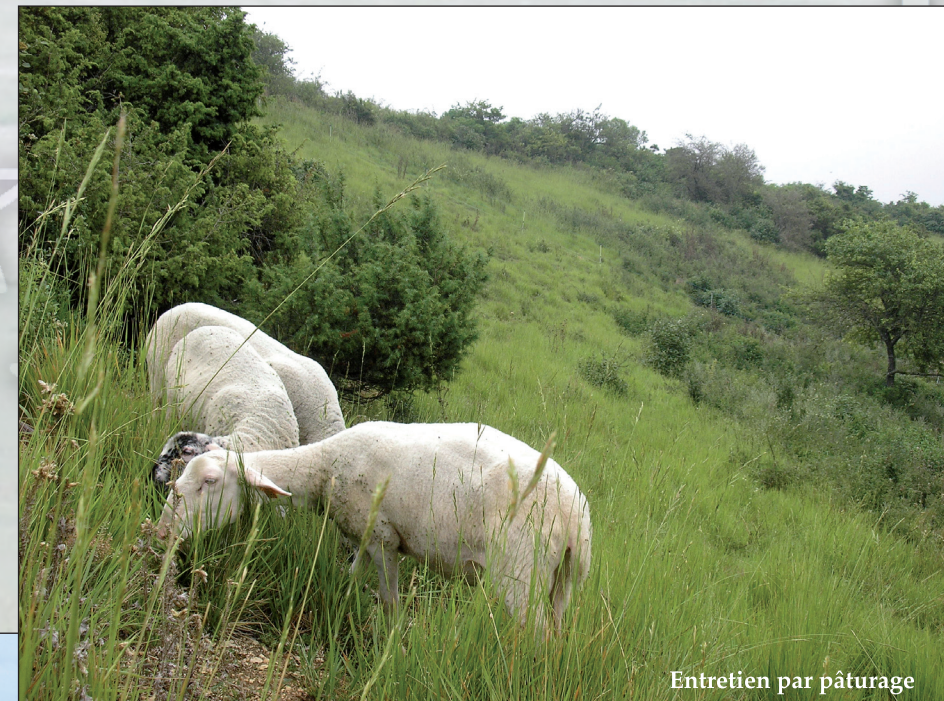
Entretien par pâturage