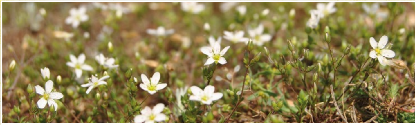
Sabline des chaumes