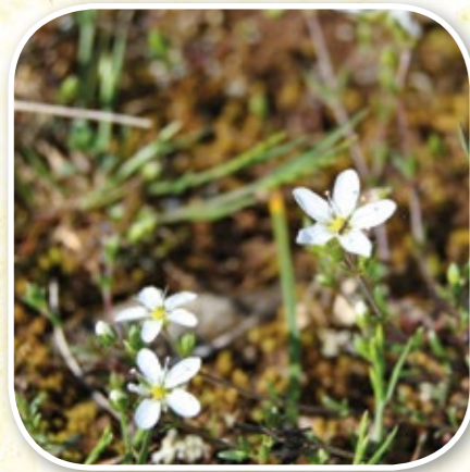
Sabline des chaumes © C. Violon