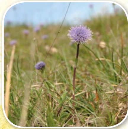
Globulaire de Valence