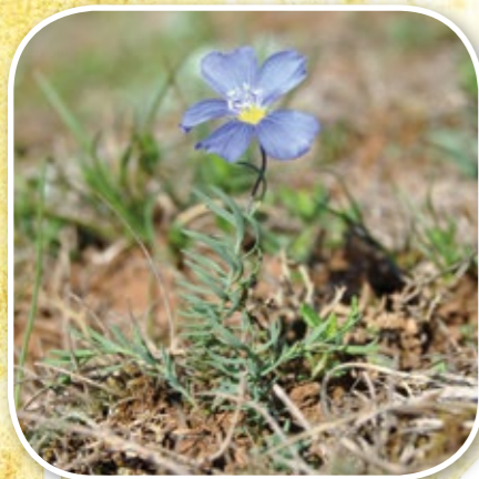
Lin d'Autriche