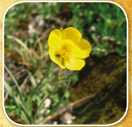
Renoncule à feuilles de graminée

Cette petite plante des pelouses sèches est difficile à repérer. Des petites fleurs blanches aux pétales pointus terminent ses nombreux rameaux. Elle peut s'apprécier de juin à août si on la cherche bien.