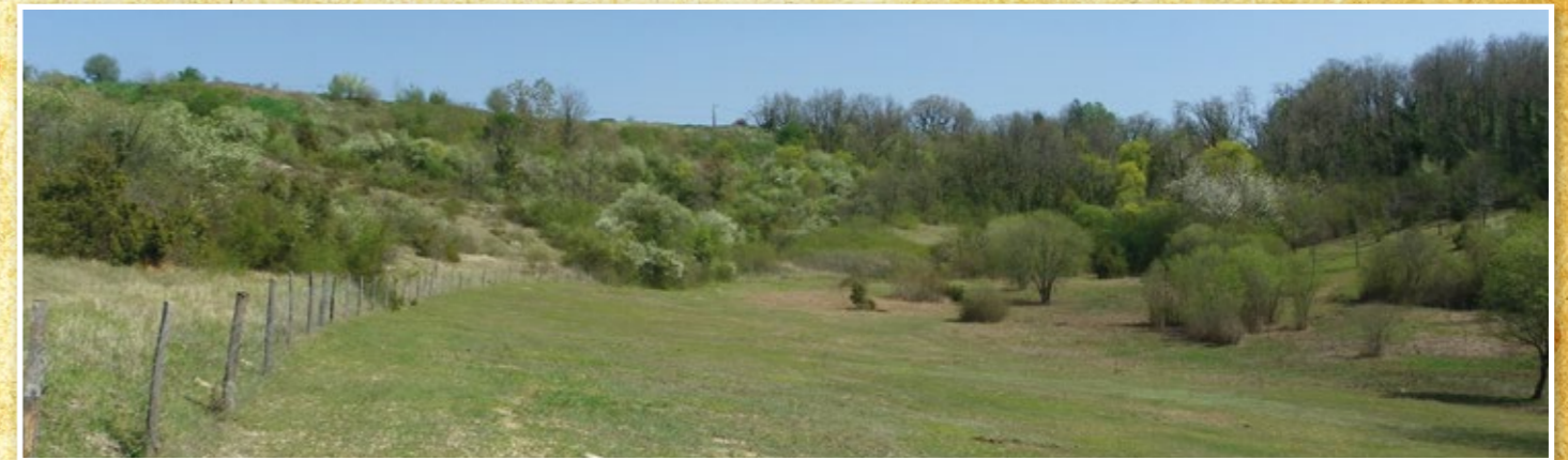
Chaumes du Vignac et de Clérignac