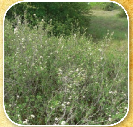
Spirée à feuilles de Millepertuis