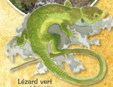
Lézard vert

Les chaumes fauchés ou pâturés présentent des physionomies différentes. Le pâturage crée des zones dénudées plus favorables aux espèces annuelles comme la Sabline des chaumes. La végétation des chaumes fauchés est plus dense, plus haute et attire d'autres espèces animales.