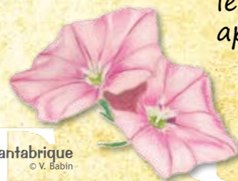
Liseron cantabrique

Les plantes odorantes comme l'Immortelle ne sont pas broutées par les animaux et constituent ce que l'on appelle des refus de pâturage.