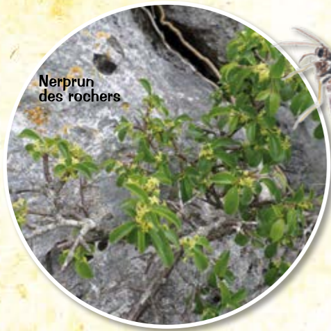
Nerprun des rochers

Les ânes sont d'une aide précieuse pour l'entretien des chaumes calcaires.