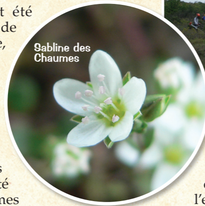
Sabline des Chaumes