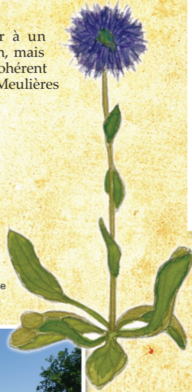
Globulaire de Valence