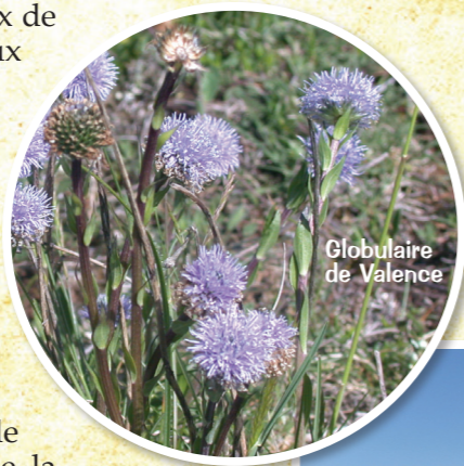
Globulaire de Valence