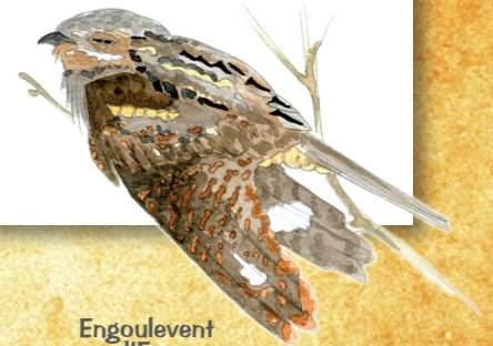
Engoulevent d'Europe

Pour tout renseignement, contactez-nous au 05 49 50 42 59 (CEN).