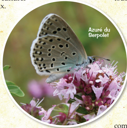
Azuré du Serpolet

Depuis 1997, le Conservatoire d'espaces naturels s'engage à préserver le site des Meulière de Claix, riche de milieux et d'espèces floristiques et faunistiques variés. Une gestion adaptée pour l'entretien et la restauration de cet espace naturel est mise en place comme, par exemple, avec la réouverture des milieux par le pâturage ovin. Mais les actions ne se limitent pas à une simple gestion. Le site a, en effet, plus de chance d'être sauvegardé si les usagers prennent conscience de l'importance de ce patrimoine naturel et culturel aux portes de chez eux.