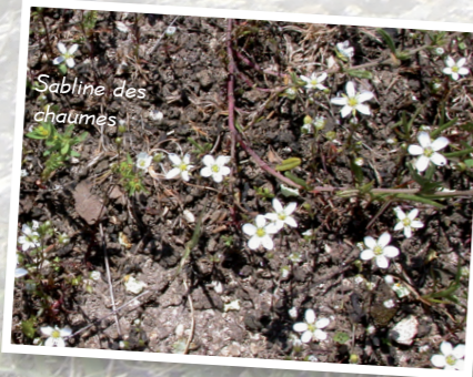
Sablins des chaumes