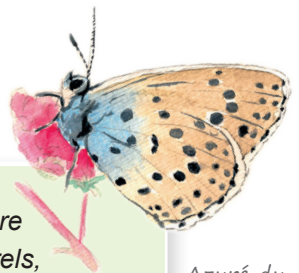
Azuré du serpolet