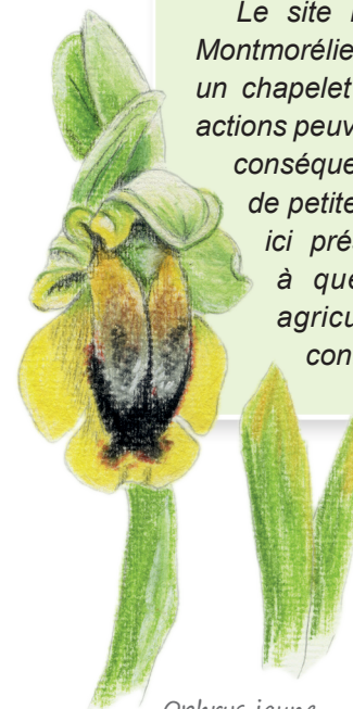
Ophrys jaune

Bulletin n°12 - février 2019 Conservatoire Régional d'Espaces Naturels de Poitou-Charentes