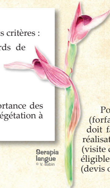
Serapia langue

Pour tout renseignement, contacter l'animatrice du site Natura 2000 :