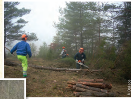
Travaux de restauration

Depuis le 22 novembre 2011, un nouvel arrêté préfectoral permet également le paiement forfaitaire des travaux réalisés par le propriétaire lui-même, calculé sur un barème régional.