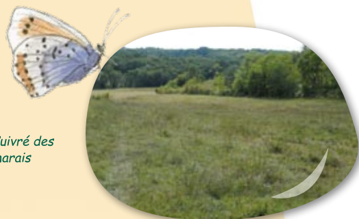
Cuivré des marais