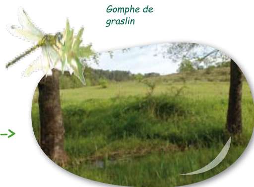
Gomphe de graslin